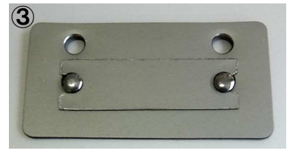
③ ①の状態より更に被りを深くしたい場合