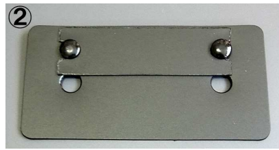
② アングラズハウス等ソールショルダーへの取付用 高さを短くカットして、キックに合せた調節も出来ます。