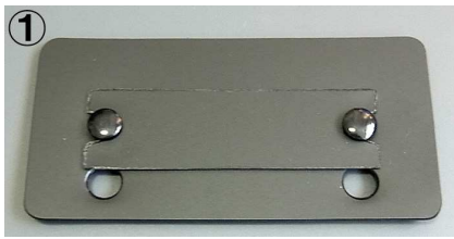
① マズメ・リバイ等、キック高さ約3cm前後用